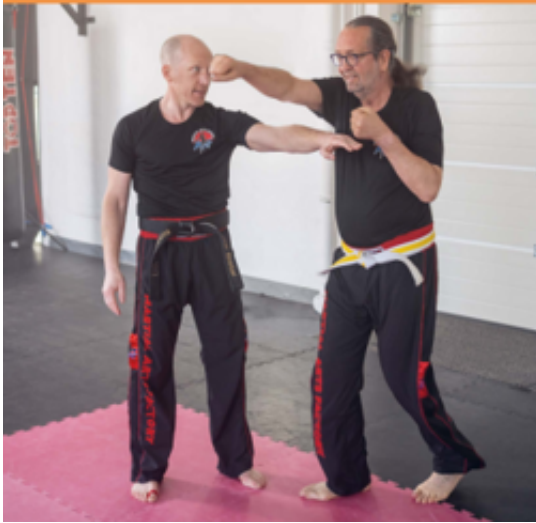
Kickboxen gegen Parkinson

Werden Sie aktiv und bleiben Sie es! Wir setzen uns für eine nachhaltige Verbesserung der Lebensqualität von Menschen mit Parkinson ein.